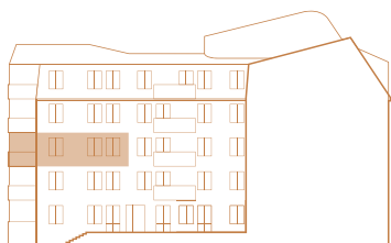
Fasad mot sydost