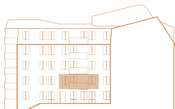
Fasad mot sydost