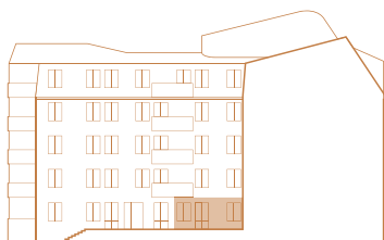
Fasad mot sydost