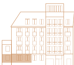
Fasad mot nordost